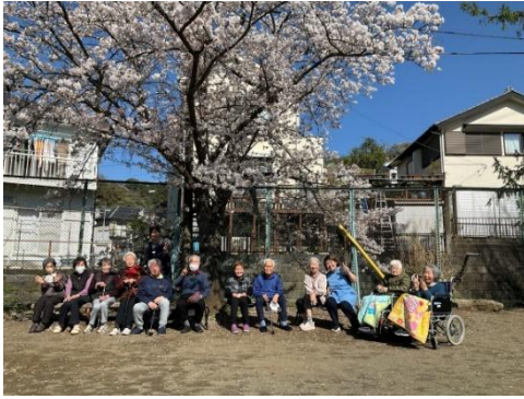
笑顔が集う春のひと時…