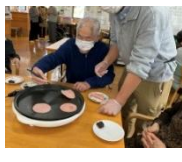
生地を慎重に焼いて…

社会福祉法人 麗寿会 デイサービスセンターふれあいの泉 (H19年6月創立) 〒247-0052 鎌倉市今泉2-4-10 電話0467-43-5975