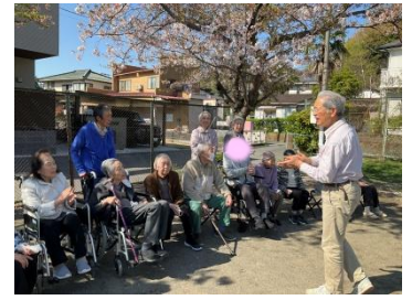
外の空気を感じながら心もリフレッシュ