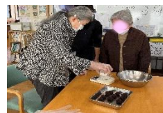
材料を量り、しっかり混ぜます