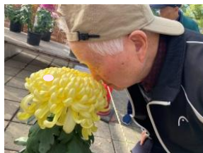
立派な菊にご対面！