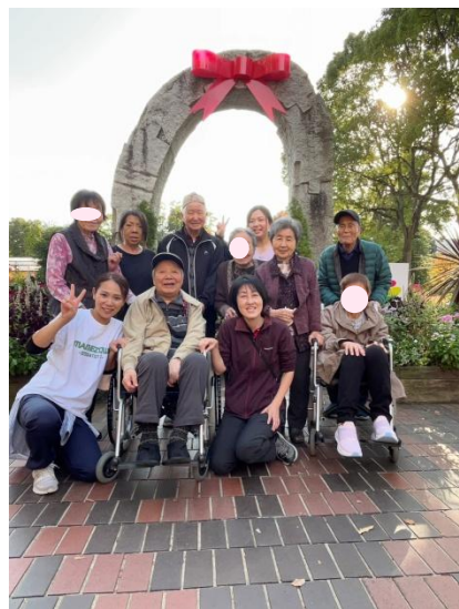
フラワーセンターの解放感の中、自然と笑顔があふれます

11月上旬、暖かい日が続きお出かけ日和の日が続きました。園内を歩きながらバラや菊、コスモスを眺め、皆さまゆったりとした時間を過ごされました。無理のないペースで歩くことで、自然と良い歩行練習にもなり、「いい運動になったよ」「楽しかったよ」といった声も聞かれました。後編も穏やかな陽ざしの中での散策を楽しまれる皆さまの様子をお届けします。