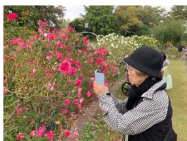
お気に入りの花を撮影中