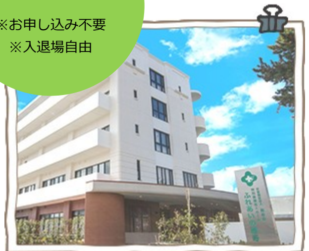
「ふれあいの麗寿」 建物外観