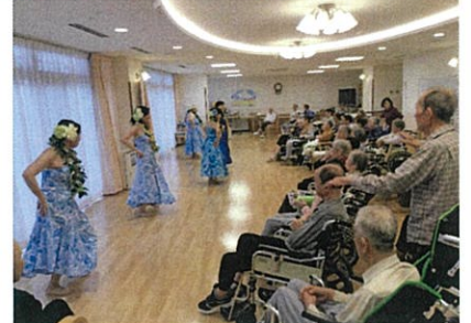
※ 左から 麗寿ツバメの巣 ・ 折り紙ボラ ・ フラダンス の写真です ※

◆ 夏祭りは 8月5日(日) 午後 開催予定です(次月以降にて詳細発信致します) ◆